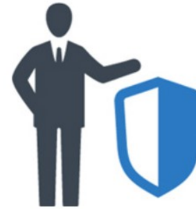
Mijn Verzekeringen ●