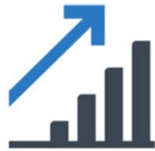
Mijn Financiën ●