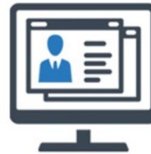
Mijn Profiel ●