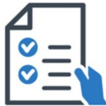
Al mijn producten bekijken